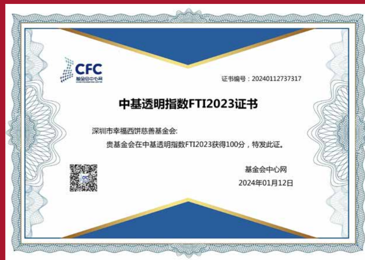
2023年中国基金会透明指数 (FTI) 满分100分证书