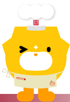
“心海守望 筑梦空间”烘焙坊

在公益的道路上，我们始终相信授人以鱼不如授人以渔。以己所长，尽己所能，我们希望通过幸福西饼专业的烘焙技术、成熟的商业经验、回馈社会的公益初心，为更多人的幸福生活创造可能。